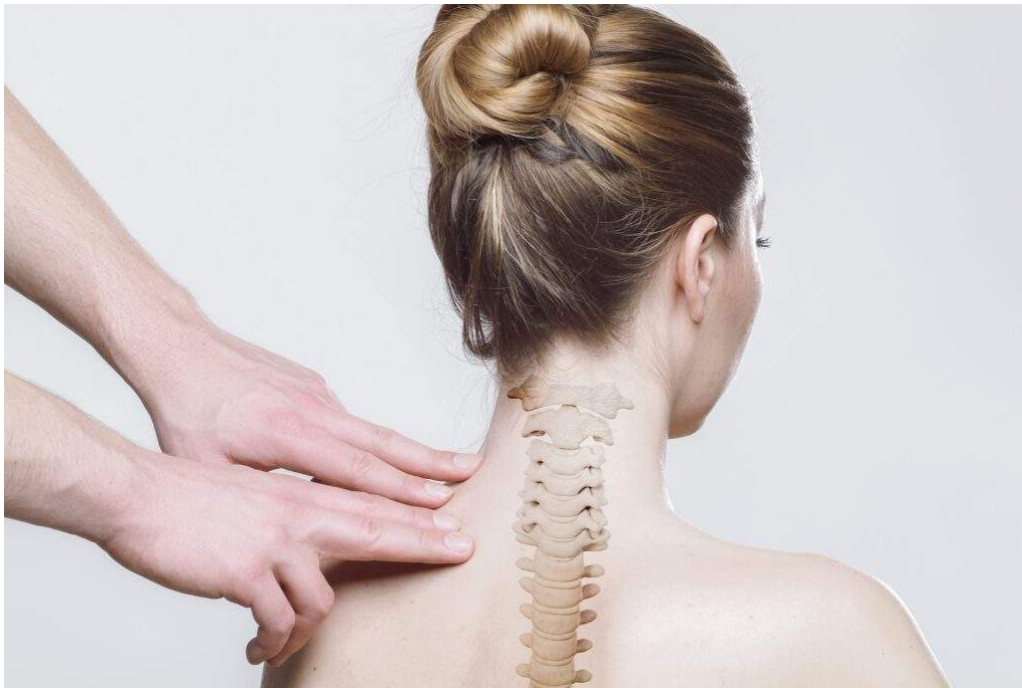
Svimmelhet, stiv nakke

Behandlingen for cervicogen svimmelhet kan omfatte kiropraktikk og fysioterapi for å hjelpe til med å styrke musklene i nakken og forbedre proprioceptive nerveimpulser. En kiropraktor vil undersøke nakken din for såkalte låsninger og spenninger. Målet med behandlingen vil være å gjenopprette god funksjon i ledd og muskler slik at man forbedrer signalene som sendes tilbake til hjernen. [2] Physical Therapy. Cervicogenic Dizziness: A Review of Diagnosis and Treatment. Hentet fra https://academic.oup.com/ptj/article/92/6/793/2739666